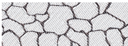
Twiga Savana - Lato A