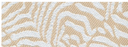
Punda Swahili Sand - Lato A