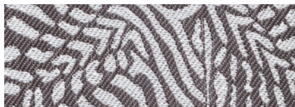
Punda Masai - Lato A