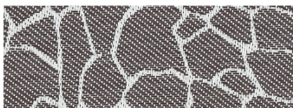
Twiga Savana - Lato B